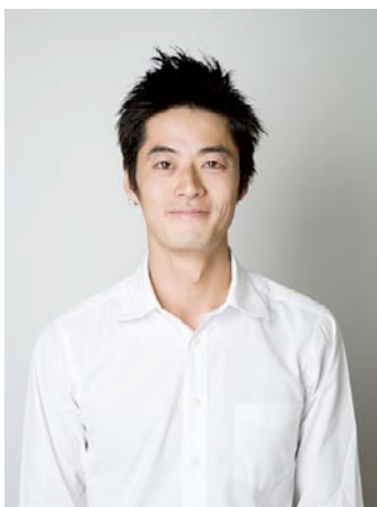
松永大輔（まつなが・だいすけ）

1975年生まれ。俳優。これまでNYLON100℃、KERA・MAP、劇団☆新感線、劇団本谷有希子などの舞台に出演する他、「踊る大捜査線」、「ストロベリー・フィールド」、「自虐の詩」などの映画や、「世にも奇妙な物語」、「プリティーガール」、「SP」、「臨場」などのドラマ、数々のCMに出演。最近ではプロデューサーとして舞台作品のプロデュースも手がける。