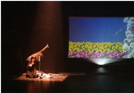
「3年2組」@吉祥寺シアター（05年）