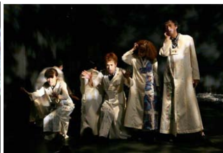
「青ノ鳥」@吉祥寺シアター（07年）