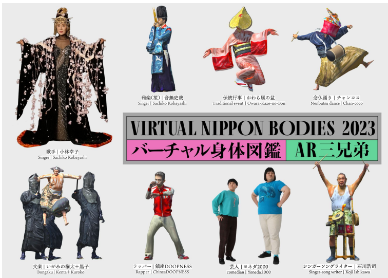
メインビジュアル

※モーションキャプチャー...関節などの人体の動作の特徴となる部位の位置と動きを記録する」ことで、人間の「動作」を記録する技術。